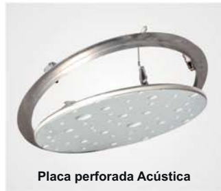
Placa perforada Acústica