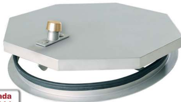
Superficie lacada con perlas de vidrio