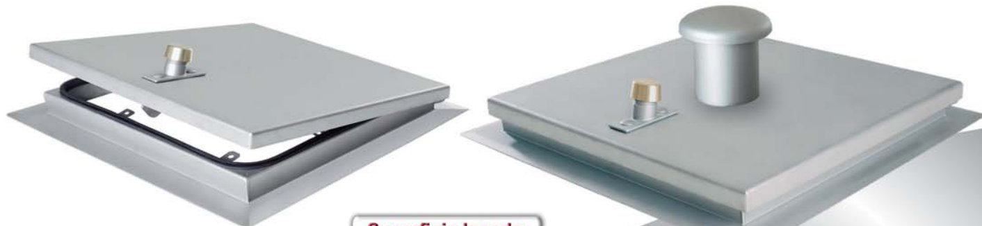
Superficie lacada con perlas de vidrio